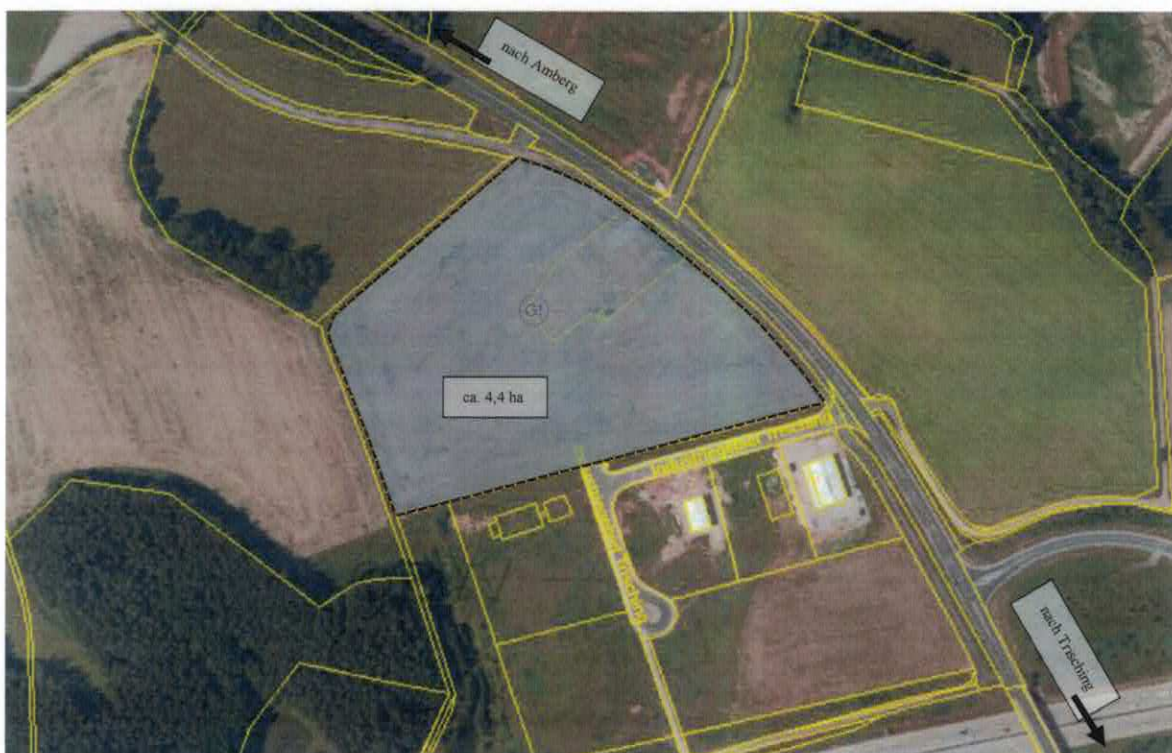
Geltungsbereich des Bebauungsplans/Flächennutzungsplanänderung: Fl.-Nrn. 1707, 1708, 1709 – Trisching

Der Entwurf des Bebauungsplans „Industriegebiet an der A6 BA II“ sowie der Entwurf der Flächennutzungsplanänderung für das Gebiet der Flurnummern 1707, 1708 und 1709, Gemarkung Trisching und die Begründung liegen vom 24.10.2022 bis einschließlich 23.11.2022 während der festgelegten Geschäftszeiten im Rathaus Schmidgaden, Schwarzenfelder Weg 9, 92546 Schmidgaden (Montag, Dienstag und Donnerstag von 08.00-11.45 Uhr, Montag und Dienstag von 13.15-16.00 Uhr, Donnerstag von 13.15-18.00 Uhr und Freitag von 08.00-12.30 Uhr) öffentlich aus.