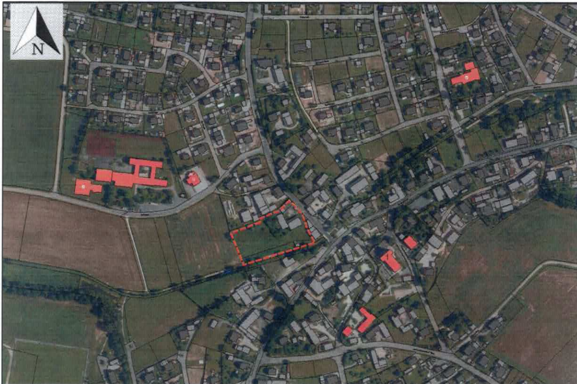
zu beplanende Fläche – Fl.-Nrn. 42, 44 und 55/2 – Gemarkung Schmidgaden

Der Gemeinderat von Schmidgaden hat in seiner Sitzung vom 11.05.2022 die Aufstellung des Bebauungsplans „Schmidgaden-Mitte“ beschlossen. Das Plangebiet umfasst das bisher als Grünland und ehemalige landwirtschaftliche Hofstelle genutzte Flurstück Fl.-Nr. 44 sowie eine Teilfläche des Flurstücks Fl.-Nr. 42 und die Fl.-Nr. 55/2 (Gemarkung Schmidgaden), liegt im Dorfzentrum und hat eine Größe von ca. 6.900 m 2 . Das Vorhaben dient der Stärkung der Innenentwicklung, sodass ein Bebauungsplan nach § 13a BauGB (Bebauungsplan der Innenentwicklung) aufgestellt werden kann. Die Gemeinde Schmidgaden möchte damit der steten Nachfrage nach Wohnflächen nachkommen.